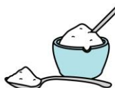
AZUCAR GLAS 50g.