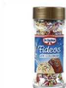
FIDEOS DE COLORES