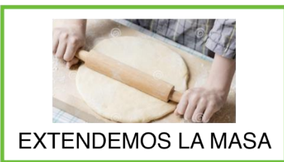
EXTENDEMOS LA MASA