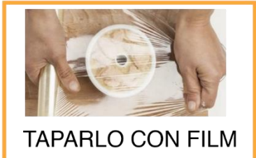
TAPARLO CON FILM